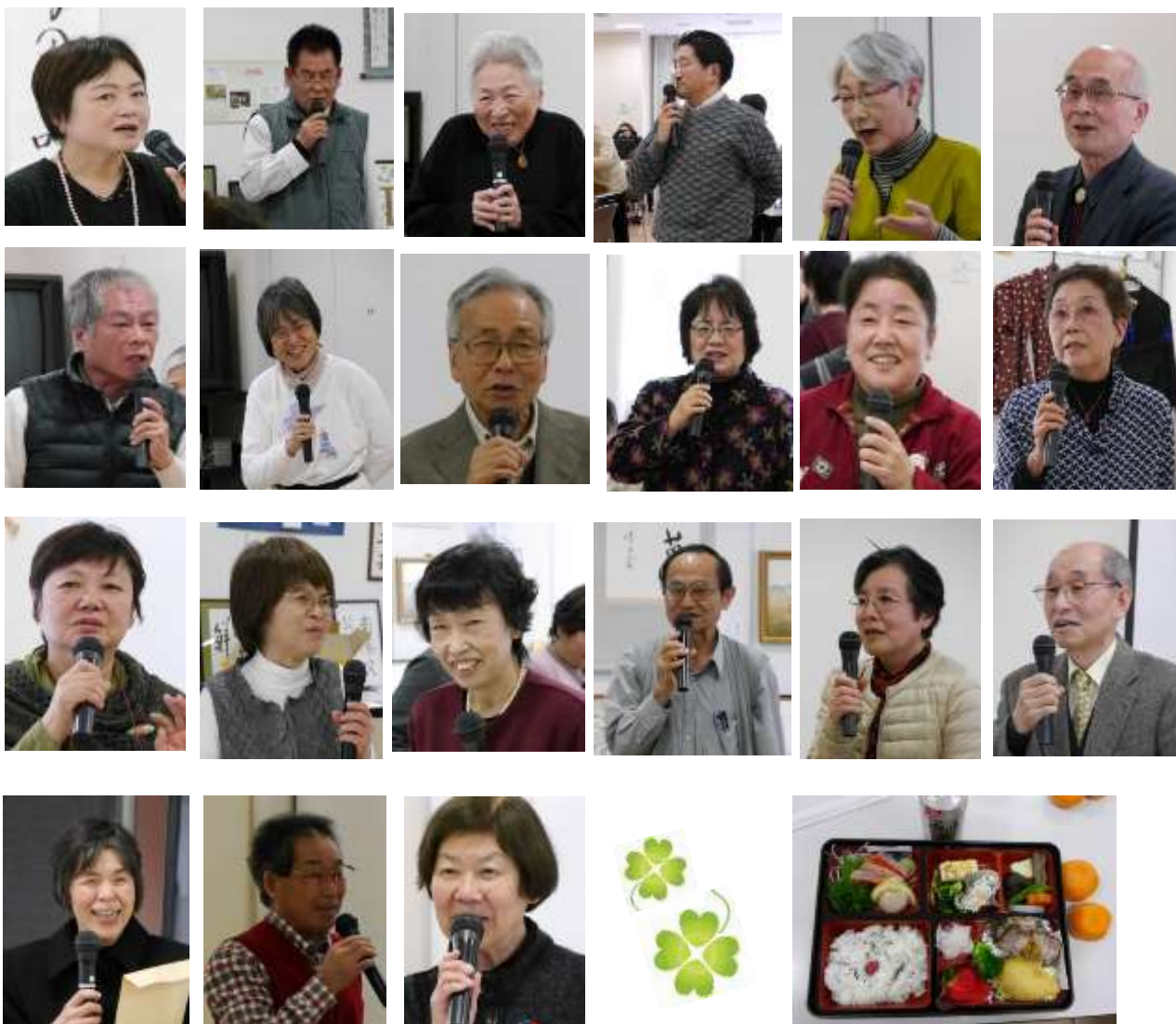
当日のお弁当・おいしかったです