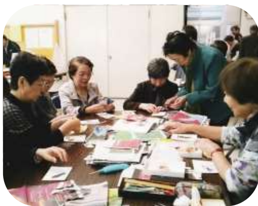
健康まつりの「ちぎり絵体験コーナー」で 組合員さんと いっしょに。