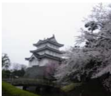
小雨にけむる忍城