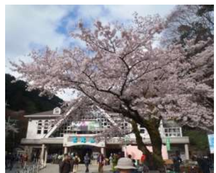
高尾山・清滝駅前