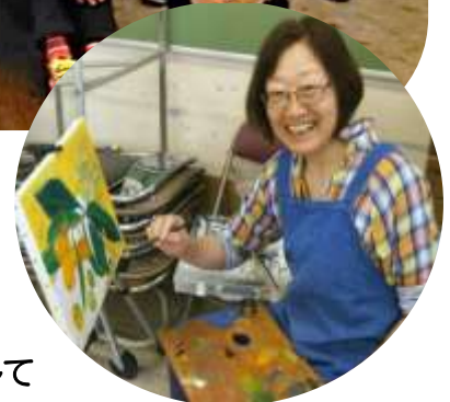
油絵をはじめました

地域のつながりづくり、誰もが安心できるまちづくりめざして 組合員の皆さんと元気に取り組んでいます。