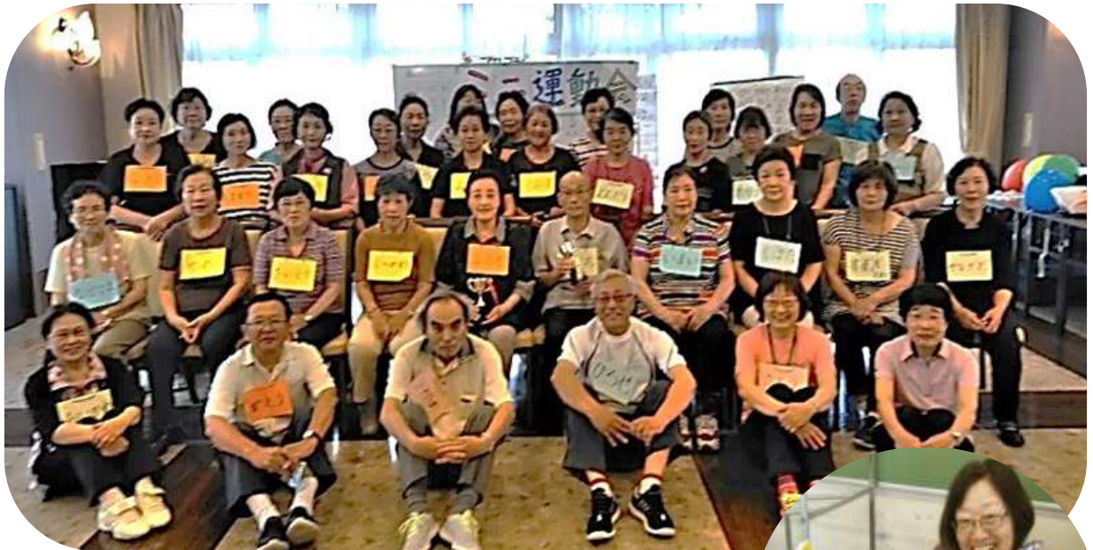
利用者と一緒に運動会