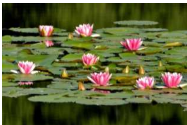
見沼自然公園に咲くスイレン 岡村和夫