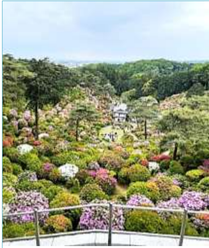
潮舟観音 小山千里