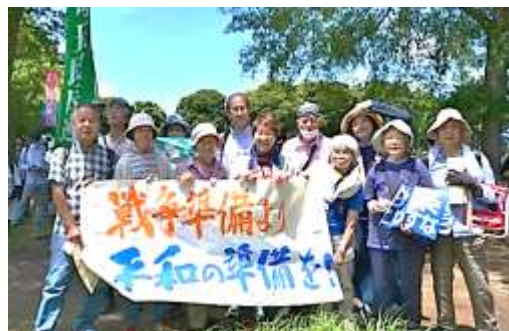
埼玉集会に参加したOB会の仲間

集会後は久々のパレード。あちこちから動員された警官が久々の警護なのか少々もたついていた。5000人のシュプレヒコールが街中に響いていました。大変だけど希望の芽がある事を感じた一日でした。